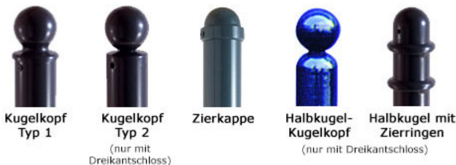
Kugelkopf Typ 1