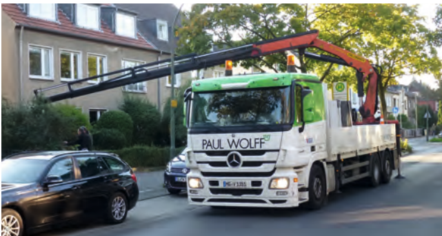
LKW beim Abladen

Der Aufstellort muss von unseren LKW mit Ladekran auf befestigten Zufahrtswegen mit ausreichender Durchfahrts-höhe erreichbar sein. Motorwagen mit Anhänger erreichen ein zulässiges Gesamtgewicht von 42 t. Nicht ausreichend befestigte Zufahrten wie z. B. Gehwege können wir nicht befahren.